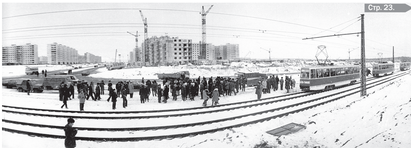
Пуск скоростного трамвая. Северо-восточная часть г. Старый Оскол — ОЭМК. Ноябрь 1980 года.

отличаясь друг от друга. Отобрать главное, правильно выдержать в проявочном растворе и успеть (!) в редакцию к утру со свежей пачкой репортажных снимков — вот про-