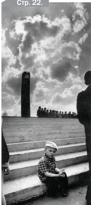
День Победы. Из серии «Память».